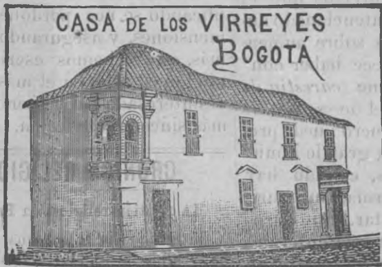
Antigua Casa de los Virreyes.

Cada día es más abundante el surtido, y las ventajas comprando en este almacén son mayores.